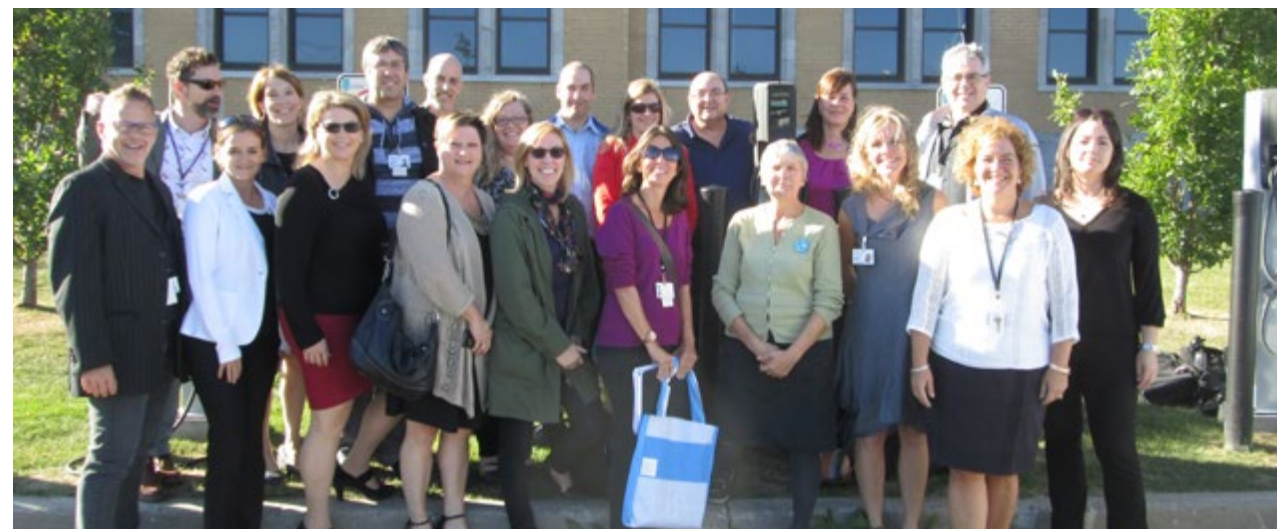
Membres du comité 2016-2017 (photo prise en 2016)

La politique a été présentée à plusieurs comités directeurs ainsi qu'aux plus hautes instances et a été adoptée le 9 novembre 2017. Un plan de communication spécifique à certaines actions a été développé afin de soutenir les initiatives du comité et d'assurer la participation et la mobilisation des destinataires.