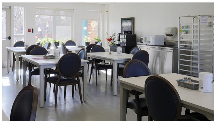
Salle à manger principale