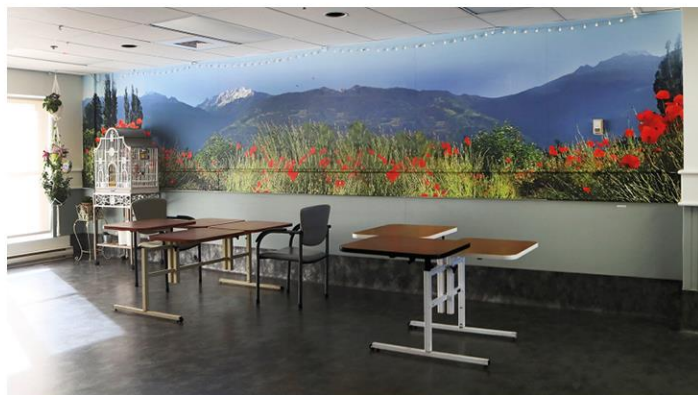
Salle à manger de l'unité de vie