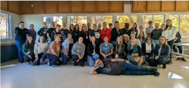
SAD – CLSC Vaudreuil

Nous avons rencontré plus de 500 personnes. L'activité de la ligne du temps « La PCI d'hier à aujourd'hui, pour demain » a été un franc succès! Nous vous remercions mille fois pour votre disponibilité et votre participation. Nous avons déjà hâte à prochaine campagne!